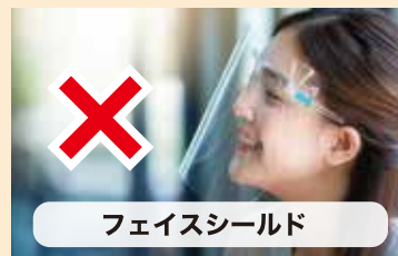
フェイスシールド