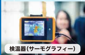
検温器(サーモグラフィー)