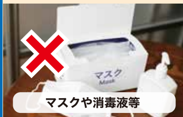
マスクや消毒液等