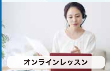
オンラインレッスン