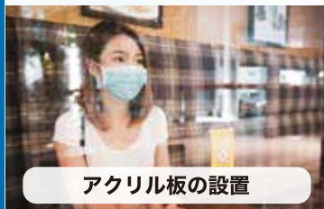
アクリル板の設置